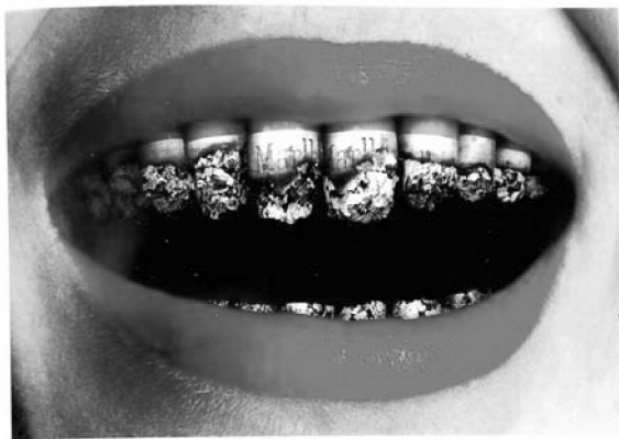
反对吸烟（海报）亚历山大（俄罗斯）