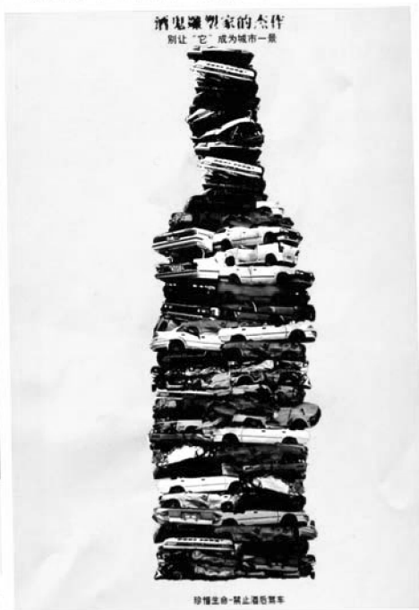
酒鬼雕塑家的杰作（海报）肖戟